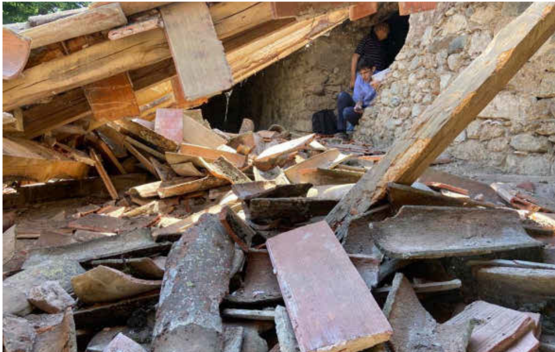
Estat de l'església de Santa Maria després que s'hagués produït l'esvoranc.

► El Consell Parroquial demana a les administracions recursos «urgents» per revertir el deteriorament del temple, on es fa missa a diari