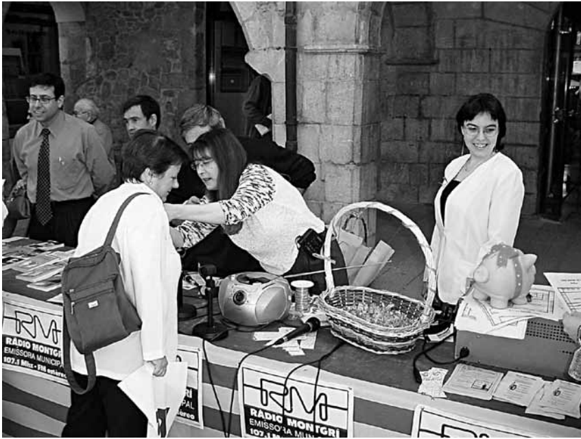
03. Estand de Ràdio Montgrí a la plaça de l'Ajuntament de Torroella de Montgrí amb motiu de la Diada de Sant Jordi (Arxiu de Ràdio Montgrí).

Cal tenir en compte que en aquell moment els transistors ja oferien l'FM en el seu dial i, aleshores, escoltar-les estava a l'abast de tothom. Posar en marxa una emissora de freqüència modulada tenia uns costos baixos, cosa que no passava amb l'ona mitjana. Això i el fet que encara no hi havia una llei sobre les emissores municipals va ser aprofitat per persones aficionades a la ràdio o per ajuntaments per obrir la seva pròpia estació.