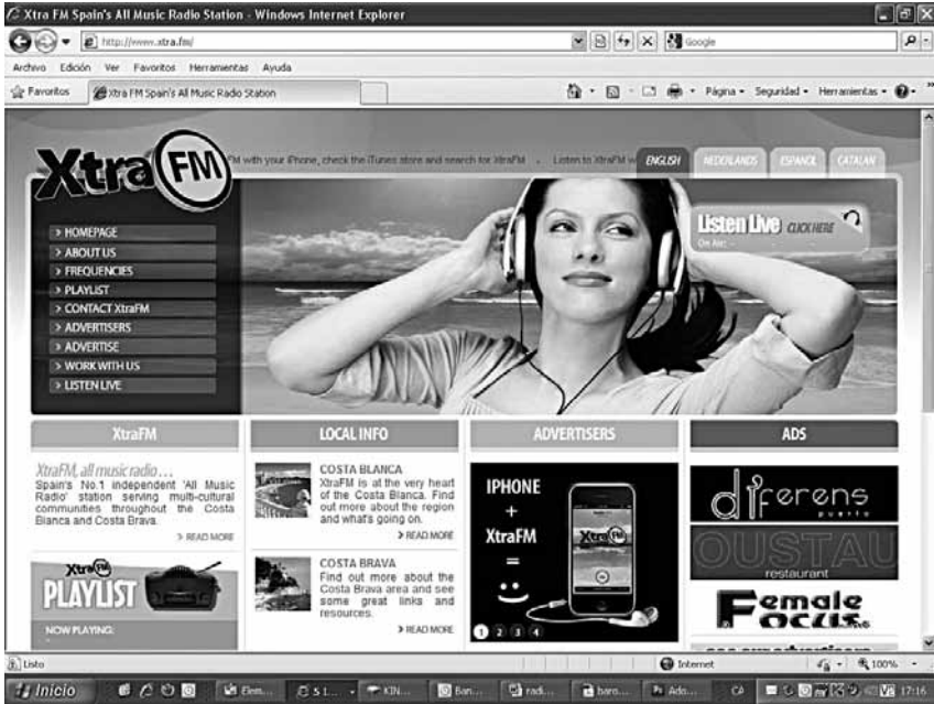
11. Web de la radiofórmula Xtra FM que emet Ràdio Santa Cristina.