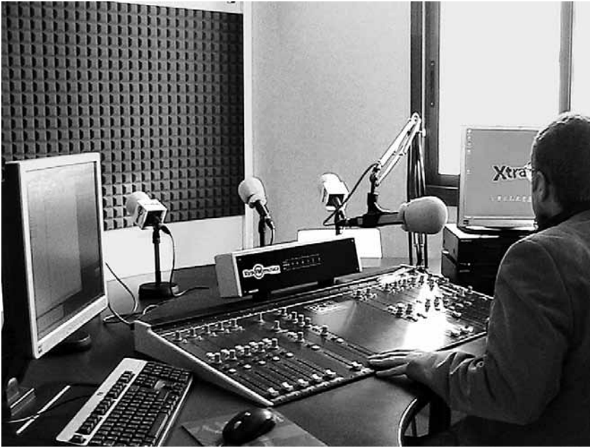
05. Estudi de Ràdio Santa Cristina on es produeix la radiofórmula Xtra FM.

De les deu emissores de proximitat que hi ha al Baix Empordà vuit són municipals, les altres dues restants són Joy FM (que pertany a l'empresa D9 Comunicació del Grup Costa Brava Global Media) i Ràdio Capital (que forma part d'una associació anomenada Acció per a la divulgació cultural de Catalunya , amb seu a Pals).