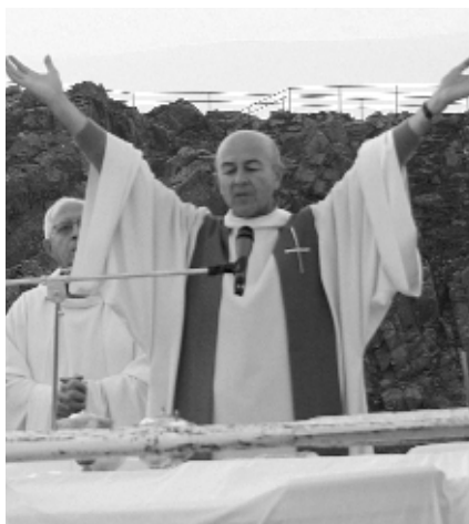
Les mans esteses, símbol de benvinguda i acolliment.

beneir, donar la pau, estendre les mans per pregar...)