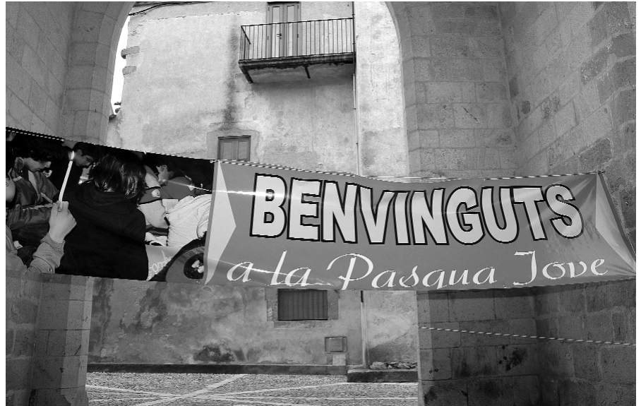
Pancarta de la Pasqua Jove celebrada l'any 2009 a Castelló d'Empúries.

El pa i el vi són formes de comunicar la presència de Crist en l'Euca-